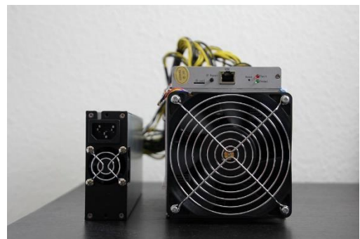
Eine spezielle Bitcoin Mining-Hardware

Wenn jetzt neue Transaktionen erstellt werden, dann versuchen die Miner diese Transaktionen in einem neuen Block zu bündeln. Neben den Transaktionen wird auch der Hashwert des Vorgängerblocks (eine kryptografische ID, die diesen Block und dessen